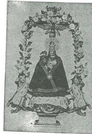
La imagen de la Virgen de la Piedad con su hermosa capa